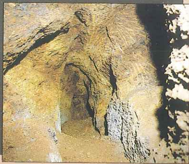
Handgeschrämtter Stollen im Barbararevier