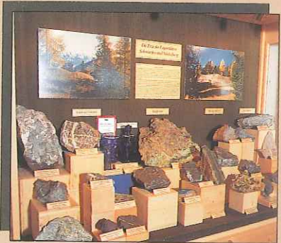
Die Erze der Lagerstätten