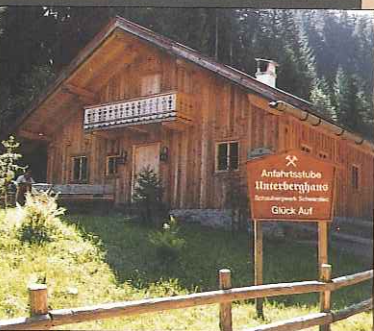
„Unterberghaus“ – die gemütliche Einkehr