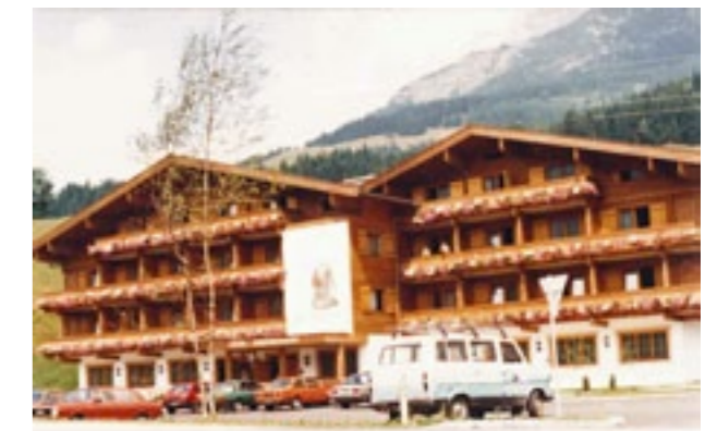
Das Hotel im Jahr 1981

2011 Renovierung des Hoteleinganges, der Bar und Rezeption, neuer Ski- und Fahrradkeller