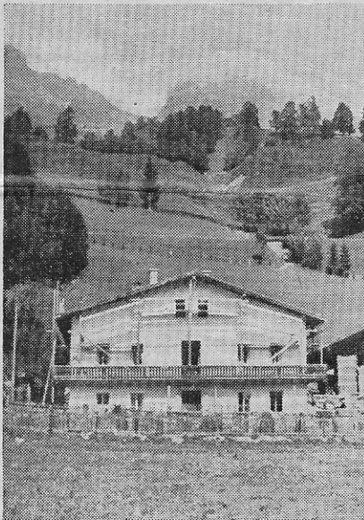
Verbesserungen am Versorgungshaus

sten auch der Preis für den Baugrund, die notwendige Verbauung der Leoganger Ache und die Abtragung und Neuerstellung des dem Forstamt gehörigen Holzkamp inbegriffen.