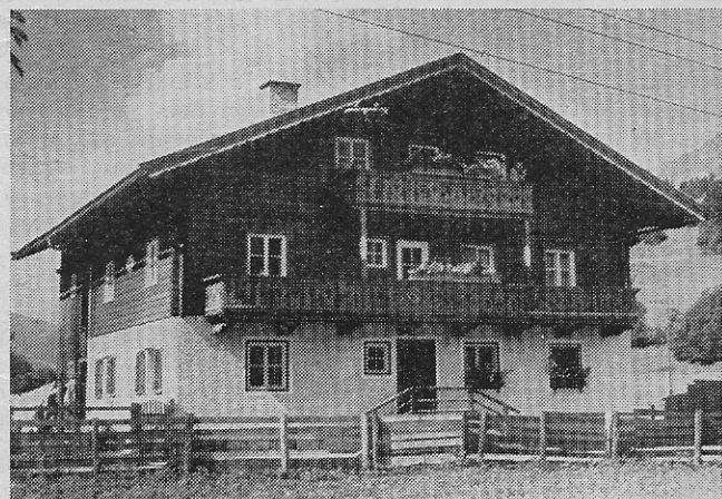
Das Haus Rosental Nr. 4 wurde zu einem schmackhaften Gebäude umgestaltet

Trotz vieler Bemühungen ist es bedauerlicherweise noch immer nicht gelungen, die Durchzugsstraße nach Tirol von Leogang über Hütten bis zur Landesgrenze als Landesstraße zu erklären. Der Aufwand für diesen derzeit noch immer als Gemeindestraße geführten Verkehrsweg steigt infolge des zunehmenden Verkehrs von Jahr zu Jahr und belastet unser Gemeindebudget in kaum erträglichem Ausmaß. Wenn man bedenkt, daß ein großer Teil unserer Aufwendungen für Straßen und Wege für diese Durchzugsstraße geopfert werden muß, wird man verstehen, daß es eine wichtige Forderung unserer Fraktion für die nächste Zukunft sein wird, diese Straße in eine Landesstraße umzuwandeln. Die laufenden Ausgaben für Straßenerhaltung