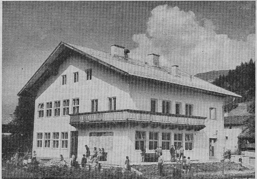
Ein Stolz der Gemeinde: die neue Schule Hütten

Die Wildbachverbauung wird auch in Hinkunft ein wichtiges Anliegen unserer Fraktion darstellen, weil durch entsprechende Vorkehrungen auf diesem Gebiet große Schäden am Gut der Ortsbewohner vermieden werden können.