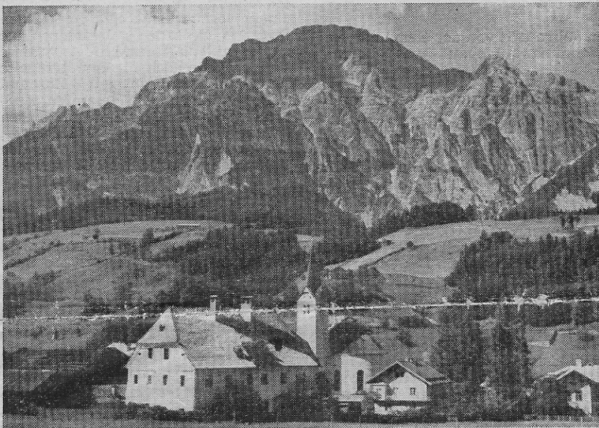
Unser schönes Leogang

Eine Gemeindefraktion gibt Rechenschaft: