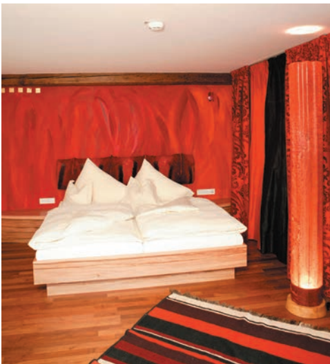
oben: das Bett „Safran“ rechts: Einblick in die „Goldsuite“