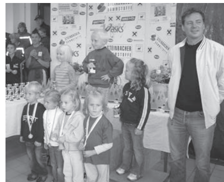
Unsere jüngsten Läufer/innen, die Zwergerl, bei der Siegerehrung