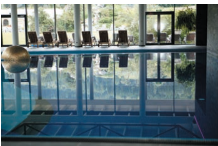
Die ansprechende Hallenbadelandschaft mit einer Goldkuppel im Wasser