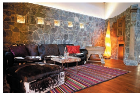
Der Wohnbereich in der „Goldsuite“