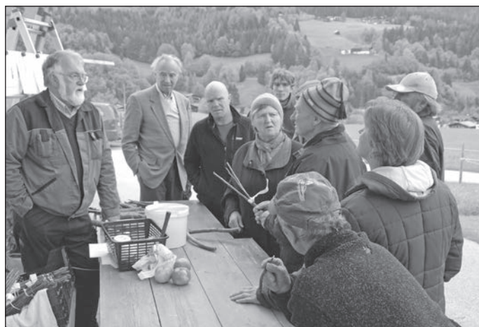
Veredelungskurs beim Obergrundbauern