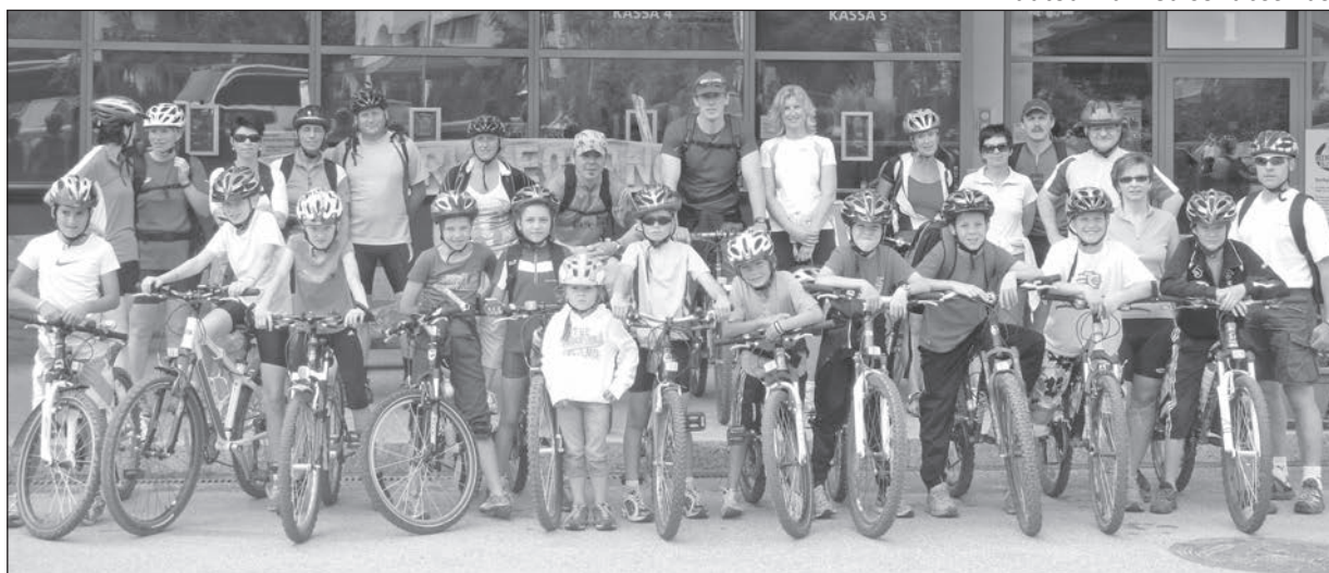
Radtour zum Saisonabschluss