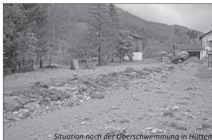
Situation nach der Überschwemmung in Hütten

Die Aufräumarbeiten werden sicherlich noch einige Wochen andauern. Wir möchten die Bevölkerung von Leogang um Verständnis bitten, dass es dadurch zu Staub- und Lärmbelästigungen kommen kann. Es ist sicherlich im Sinne aller Leogangerinnen und Leoganger, den Ursprungszustand unserer Wildbäche und betroffenen Gebiete wieder herzustellen bzw. diese zu sanieren. Nicht zuletzt wegen der Sicherheit für die Leoganger Bevölkerung.