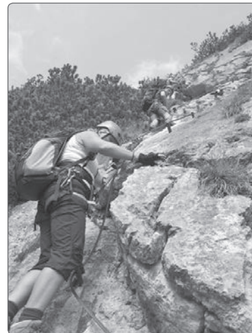
Klettersteig am Donnerkogel