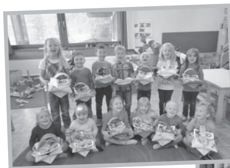
Impressionen vom letzten Kindergartenjahr!

Wir wünschen unseren Erstklässlern einen erfolgreichen Schulbeginn!