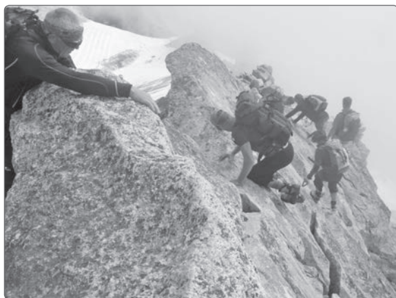
Klettern am Südostgrat des Olperers