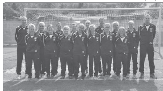
Die Damenmannschaft bei ihrem ersten Heimspiel