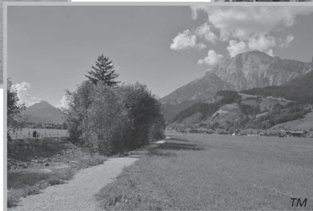
Achenweg bei Ecking