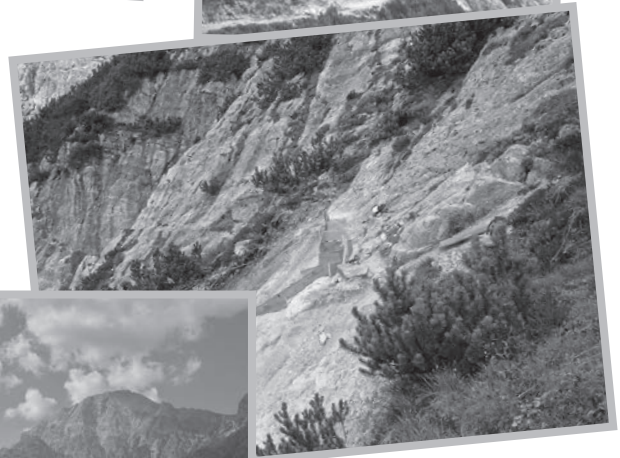
Weg Passauer Hütte