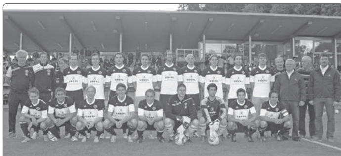
Die neuen Dressen der Firma Eberl - Herzlichen Dank!