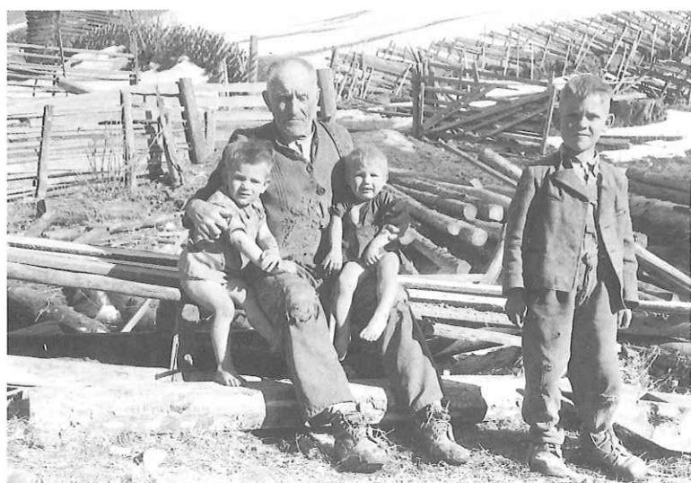
Im Jahre 1948 lebten mehr als 56.000 Menschen, sogenannte »Displaced Persons« in Lagern in der Stadt Salzburg, in Oberndorf, Hallein, Bischofshofen, St. Johann i. Pg. und Zell am See