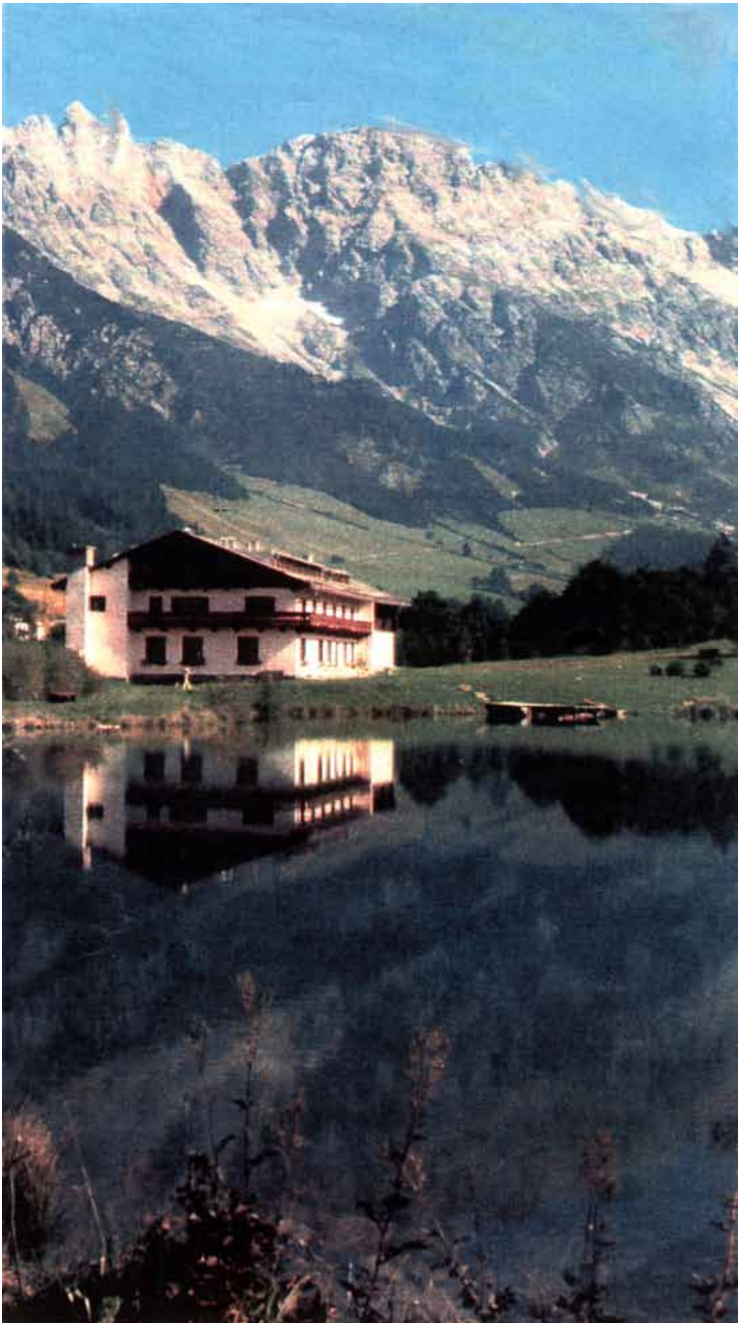
Abb. 5: Das „Clubhotel Hinterthal“ 1965 vor dem prächtigen Hochkönig-Massiv