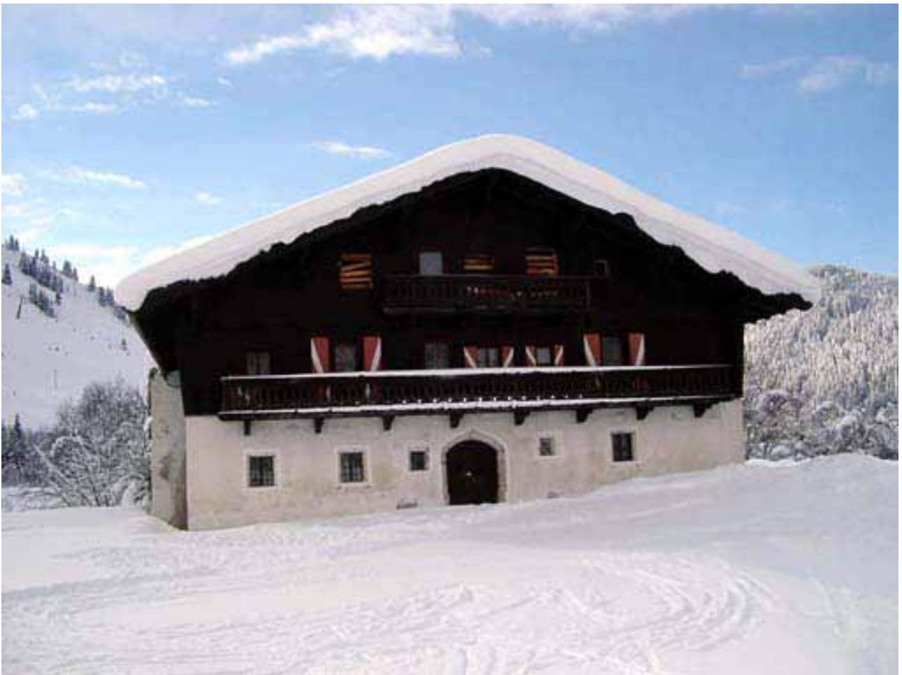
Abb. 1: Das unbewohnte Schwaiger-Lehen in Hinterthal im Winter 2000 - von der idyllischen Seite gesehen.