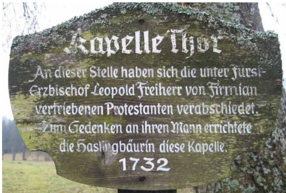
Abb. 29: Gedenktafel neben der Kapelle