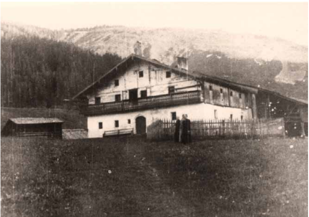
Abb. 3: Das Schwaiger-Lehen wurde 1938 noch als Bauernhaus benutzt