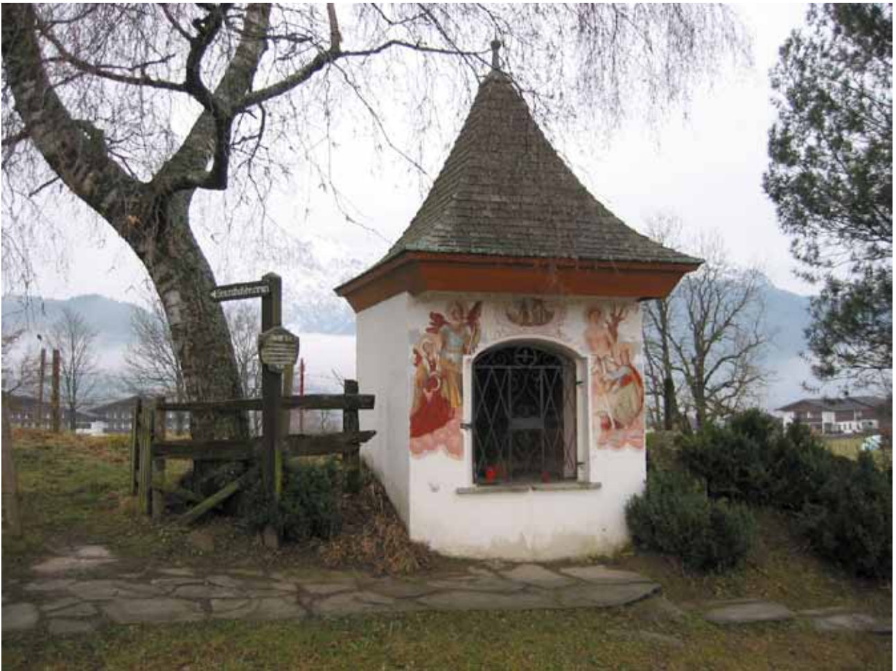
Abb. 28: Kapelle in Thor/Saalfelden