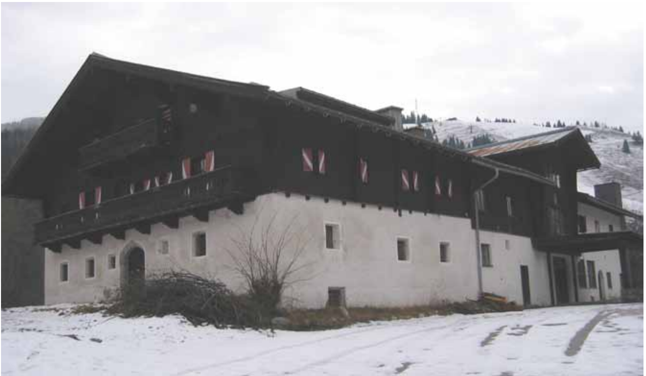
Abb. 2: Das Schwaigerlehen 2002 mit dem seit Jahren aufgelassenen „Clubhotel Hinterthal“, das ca. 1960 angebaut wurde