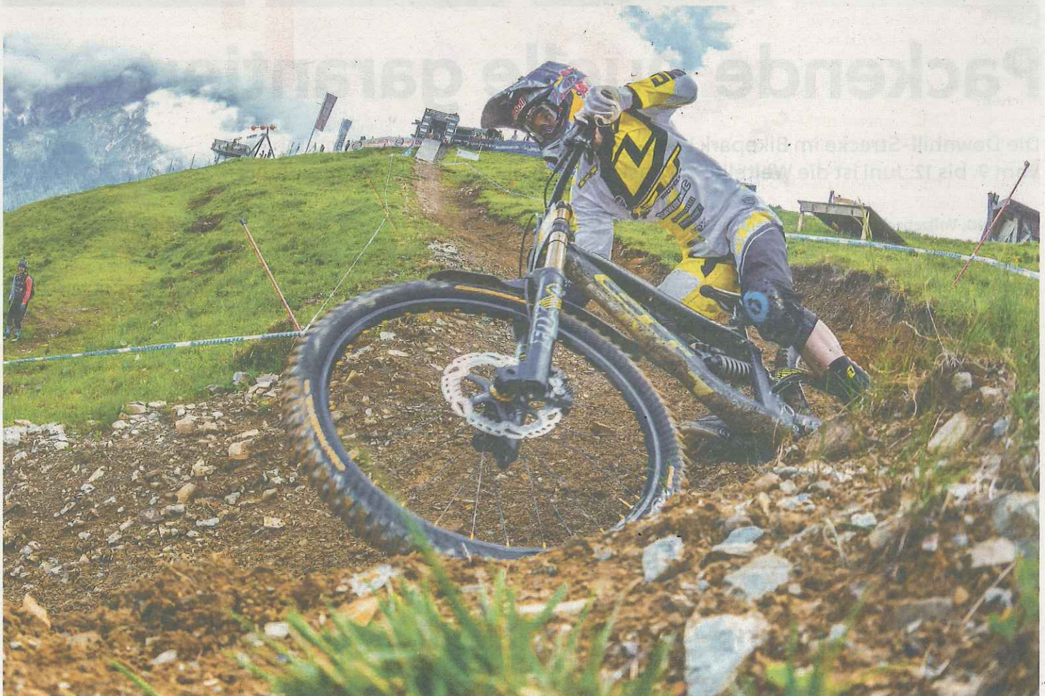
Der spektakuläre Downhill-Weltcup: Mit Vollgas über die 3100 Meter lange Speedster-Strecke den Asitz hinunter.

Mehr dazu lesen Sie auf den nächsten Seiten bzw. unter WWW.MTB-WELTCUP.AT