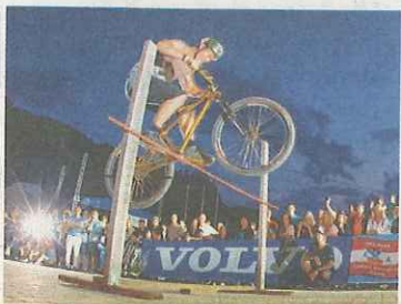
Der Bunny Hop Contest beim Hotel Bacher – für Erwachsene.