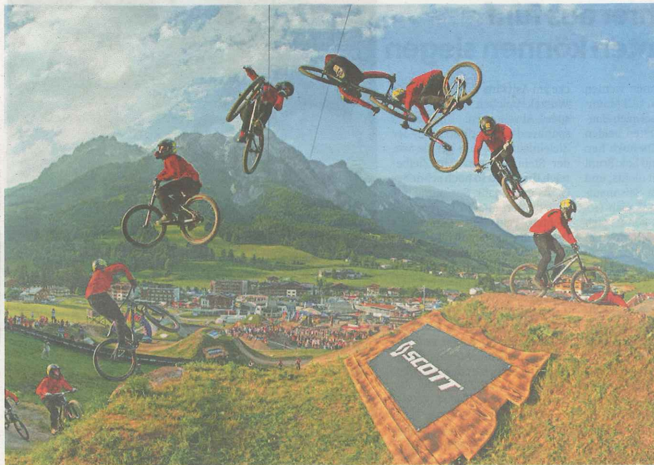
Die besten Trickser der Welt sind in Leogang am Start.