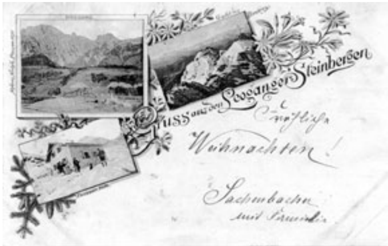
Eine Ansichtskarte aus dem Jahr 1895 zeigt die Passauerhütte, den Gipfel des Birnhorns und eine Dorfansicht