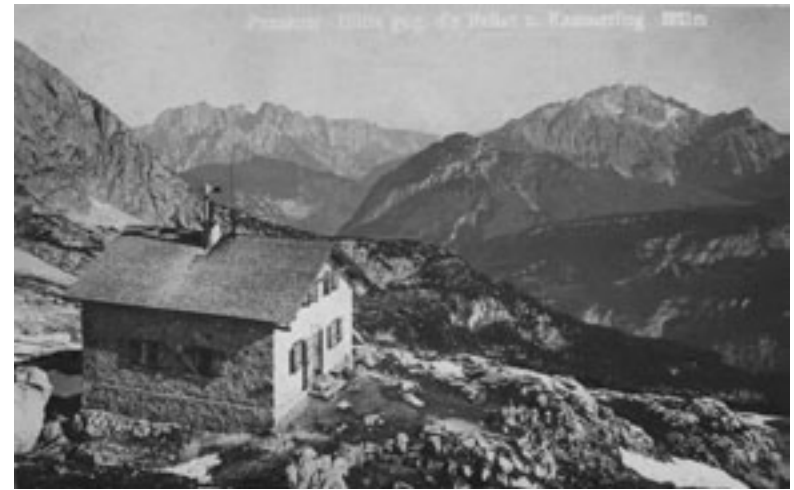
Die Passauerhütte um 1935