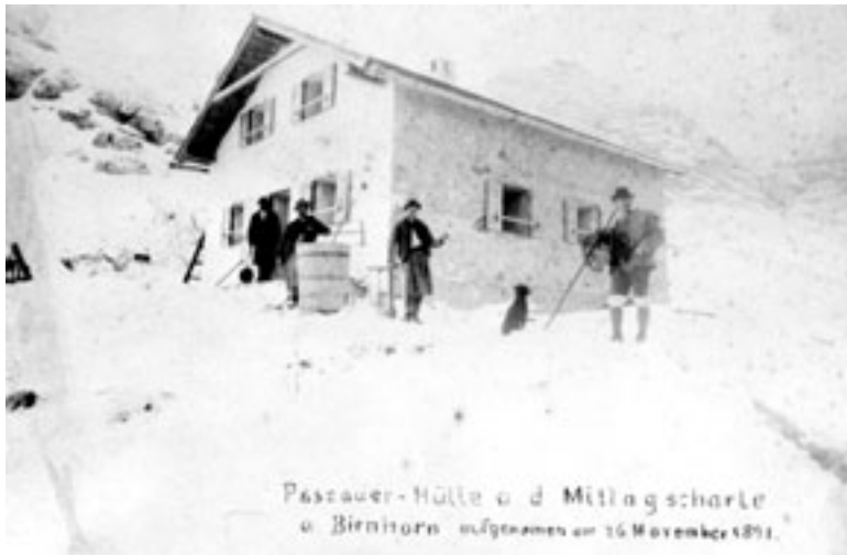
Die neu erbaute Passauerhütte im November 1891