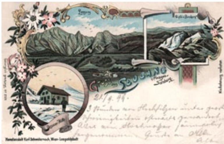
Die Leoganger Steinberge auf einer Ansichtskarte aus dem Jahr 1899 mit der 1891 erbauten Passauerhütte