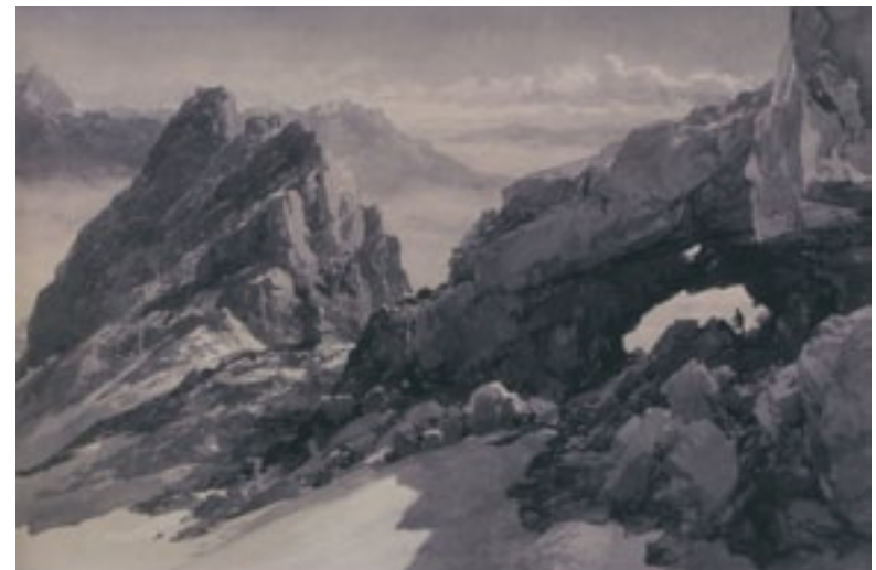
C.T. Compton: Melcherloch, Passauerhütte und Mitterhorn um 1900