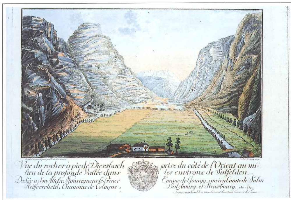
Die Hohlwege – in Richtung Saalfelden; kolorierte Radierung von F. Naumann, 1792; KAS.

tung der Brücke in Weißbach, wobei sie wiederum den Mittersillern einen Teil ihrer Auslagen verrechnen durften.